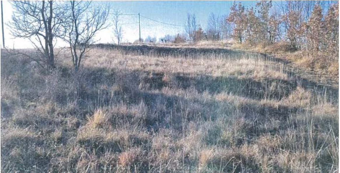
zemljište i prilazna cesta